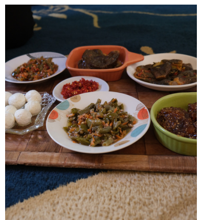
Köstlichkeiten bei einem der Hausbesuche